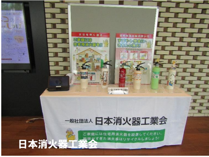
日本消火器工業会