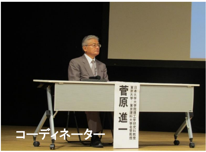
コーディネーター