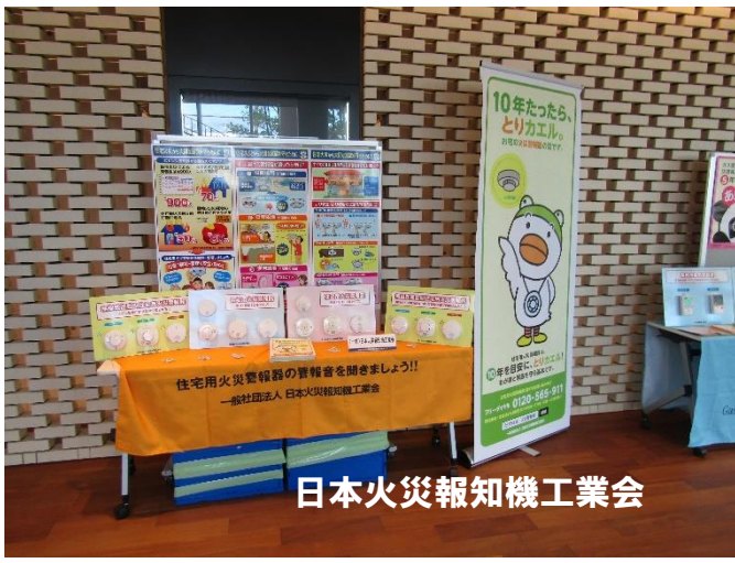
日本火災報知機工業会