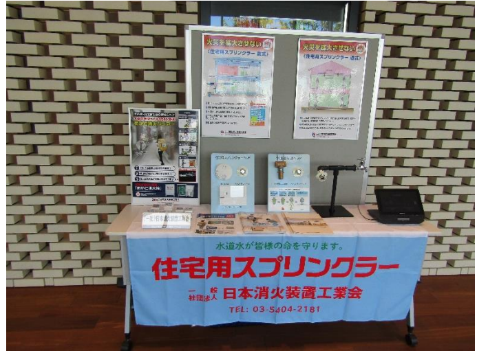
住宅用スプリンクラー 一般社団法人 日本消火装置工業会 TEL: 03-5404-2181