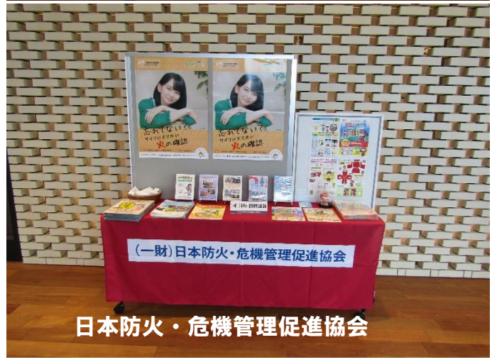
(一財)日本防火・危機管理促進協会