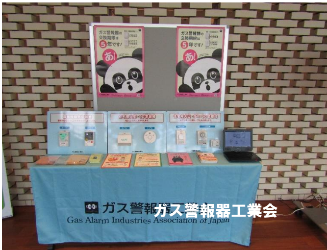
ガス警報器の交換期限は5年です。 Gas Alarm Industries Association of Japan