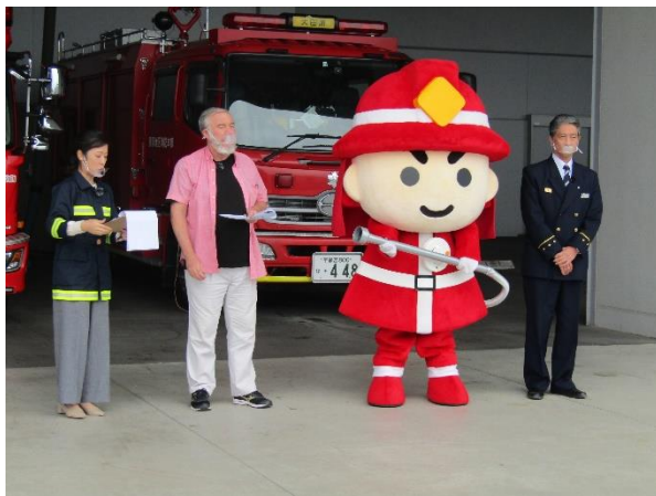
オープニング撮影風景