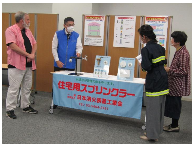
(一社)日本消火装置工業会