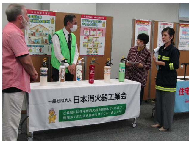
(一社)日本消火器工業会