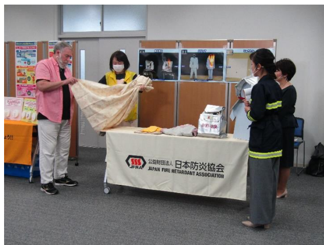
(公財)日本防災協会