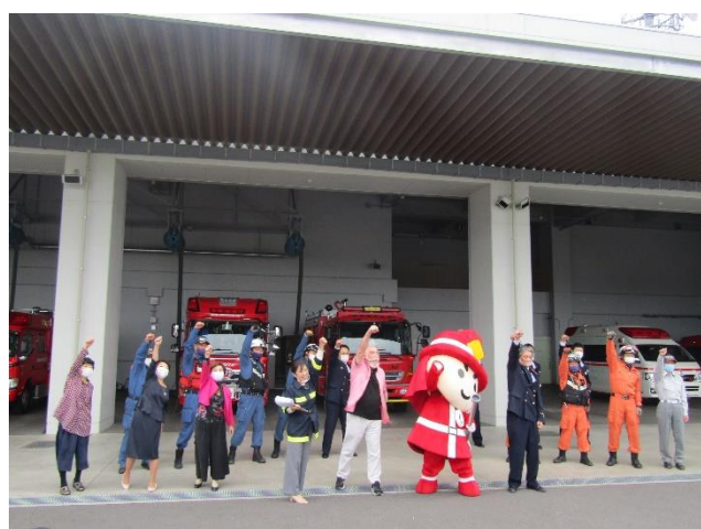
エンディング撮影風景