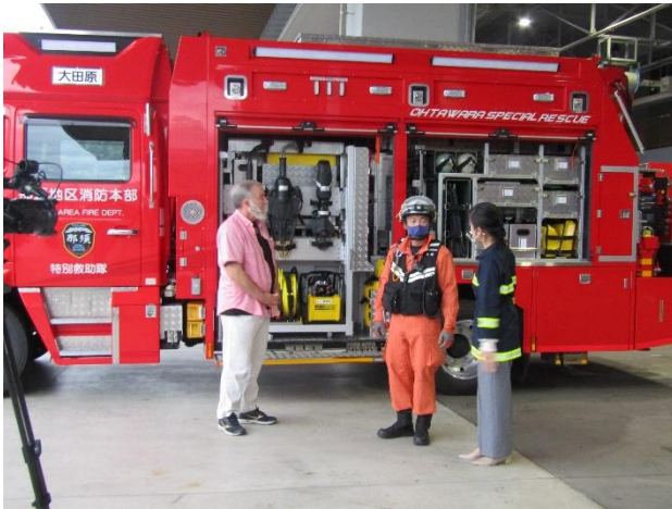
救助工作車の紹介