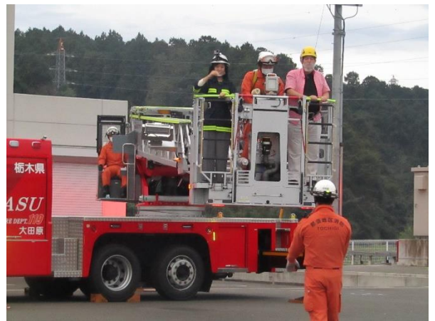
はしご車訓練紹介