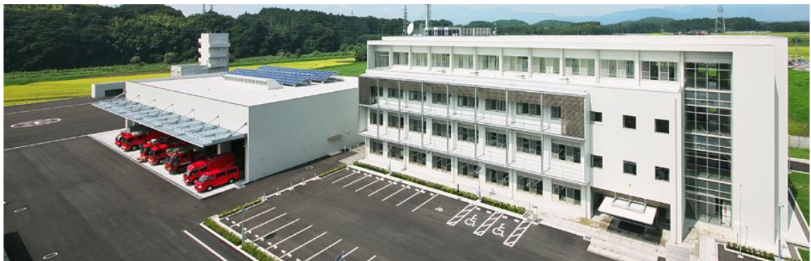
那須地区消防本部