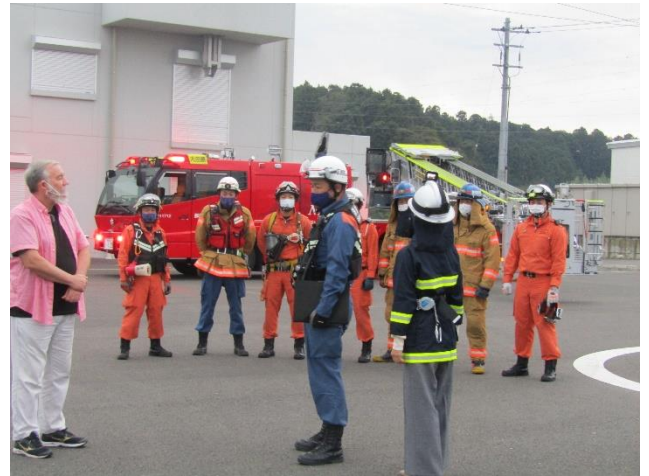
はしご車訓練の紹介