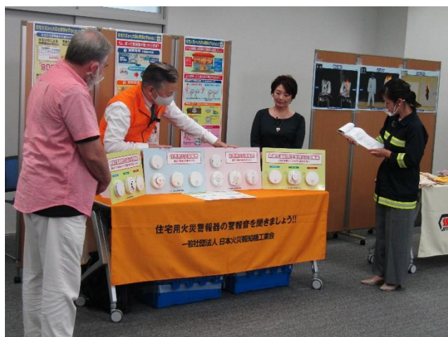
(一社)日本火災報知機工業会