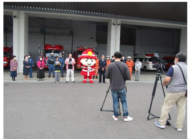
エンディング撮影風景