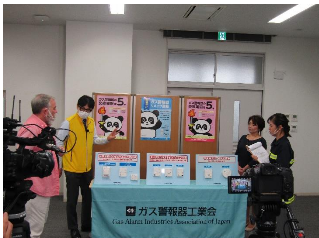
ガス警報器工業会